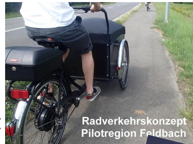
Radverkehrskonzept Pilotregion Feldbach