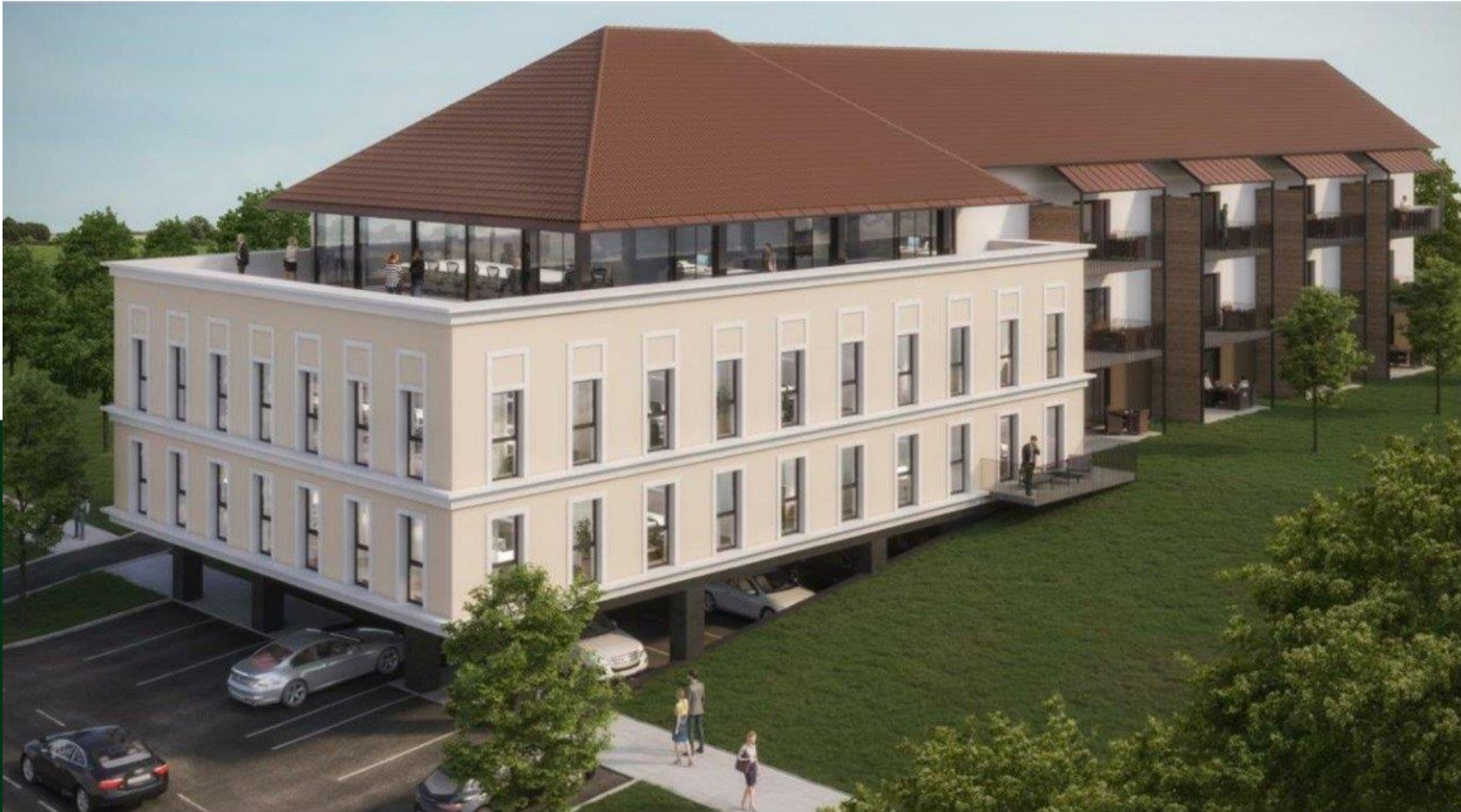
Visualisierung DI Erich Paugger