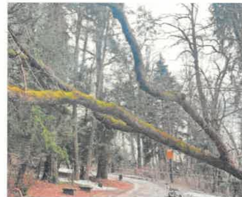
Am Buchkogel hinterließ der massive Schneefall am 20. Februar genauso Spuren wie am Schloßberg und im Leechwald (Foto)