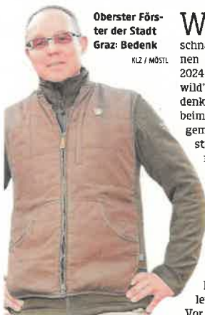
Oberster Förster der Stadt Graz: Bedenk

Gestern liefen Vorarbeiten für Rodungen im Bereich der Hilmteichstraße vom Stapel. Dass rund um die Baustellen für den Speicherkanal und den zweigleisigen Ausbau der Linie 1 insgesamt 14 Bäume umgeschnitten werden, ist ja schon lange klar – dass man es jetzt macht, hat laut Holding Graz mit ökologischen Gründen zu tun: So sollen etwa Vögel während der Brutzeit nicht gestört werden. Im Gegenzug betont man seitens der Holding, dass 36 Bäume „an besseren Standorten“ neu gepflanzt werden.