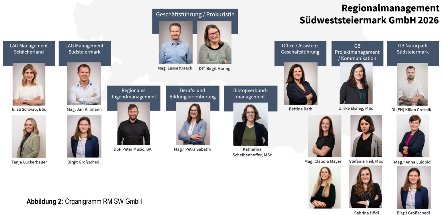
Abbildung 2: Organigramm RM SW GmbH

Um den Abstimmungserfordernissen der einzelnen Geschäftsbereiche nachkommen zu können, teilweise im Rahmen von EU-Verordnungen vorgegeben (z.B.: LEADER), wurden seitens des Regionalvorstandes einzelne Entscheidungsbereiche an andere Gremien delegiert. Diese Regelungen wurden jeweils in enger Abstimmung mit den betroffenen Landesabteilungen (A17, A13) getroffen.