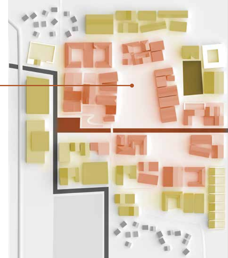
■ Den bestehenden Ortskern stärken. ■ Umgebendes Areal zu Fuß und per Fahrrad an den Ortskern anbinden.

Entwicklungsstrategie für das Zentrum Eine maßgeschneiderte Entwicklungsstrategie für den Orts- oder Stadtkern wird auf Basis des starken Zukunftsbildes erarbeitet. Dafür werden aufeinander abgestimmte kurz-, mittel- und langfristige Einzelprojekte definiert und die Entwicklungsstrategie zum dauerhaften Thema gemacht. Zur Realisierung und flexiblen Adaption der Entwicklungsstrategie werden Strukturen in der Gemeinde aufgebaut und qualifiziert, eine kontinuierliche Kommunikation begleitet den Prozess.