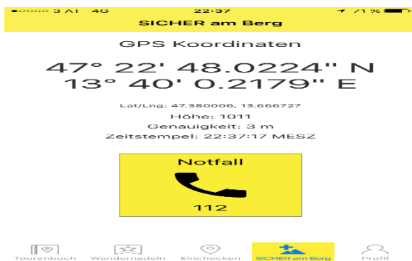
Abb.1: GPS-Koordinaten

Besonders wichtig ist den Entwicklern, dass die App in ihrer Funktionalität weiterwächst und auch zukünftig als richtungsweisend in ihrem Bereich gilt. Dazu wird laufend an der Usability, und den Nutzungsmöglichkeiten für alle Plattformen wie Apple oder Android weiterentwickelt. Des Weiteren stehen neue Anwendungsbereiche wie etwa die Apple Watch oder Chatbots und eine bessere Integration sozialer Netzwerke im Fokus.