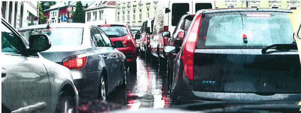
Es ist eng geworden auf den Grazer Straßen. Das und womöglich wirtschaftliche