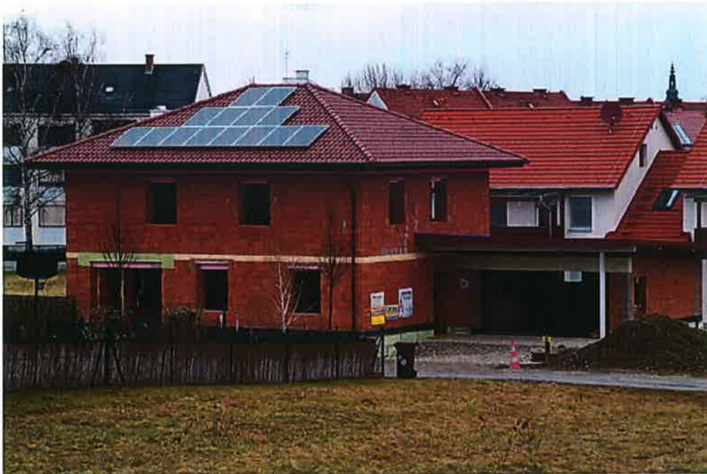
In Fürstenfeld, der größten Stadt im Bezirk, herrscht eine rege Bautätigkeit.