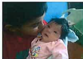
Funima International freut sich über die Geburt des Babys in Hijos del Sol.