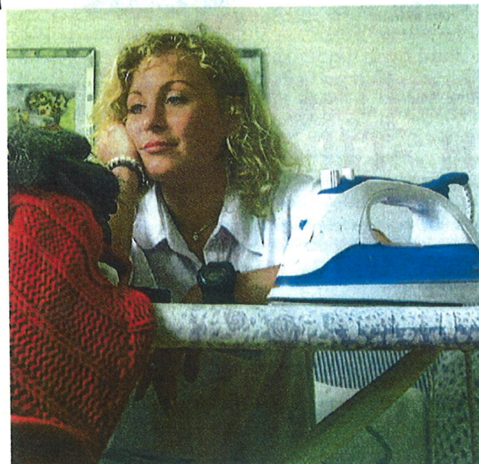
Single-Haushalte sind im Kommen – besonders in Graz wird es mit dem Wohnraum eng.

Eindeutiger Trend: Immer mehr Menschen leben allein – vorzugsweise im Großraum Graz.