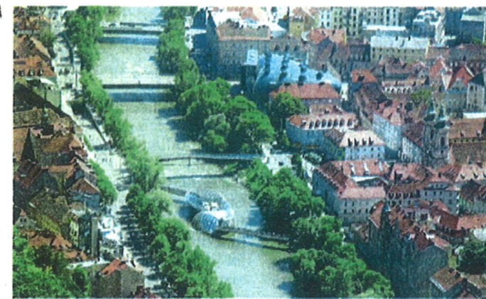
Im Jahr 2050 wird der Großraum Graz 229.000 Haushalte haben – das sind 40 Prozent aller steirischen Haushalte.

Herausforderung für Politik und Städteplaner: „Dieses enorme Wachstum hat sich Graz nicht unbedingt gewünscht. Aber die Urbanisierung ist ein globaler Trend, der nicht aufzuhalten ist. Als Stadt bedeutet das, jährlich 2.000 neue