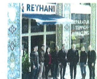
Das Reyhani-Team in der Schönaugasse 49 berät Sie gerne!