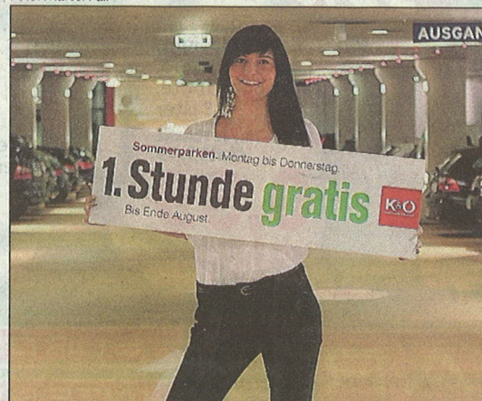
▲ Gratisparken: Eine Kastner & Öhler-Aktion

Titel gewann Leibnitz. Als Grazer wundert man sich ein wenig, wurde Graz doch schon mehrere Male zur fahrradfreundlichsten Stadt Österreichs gekürt. Aber sei's drum. Gemeinsam mit Heimschuh, Großklein, Frohnleiten, Gratkorn wurde Graz immerhin zur fahrradfreundlichen Gemeinde gekürt.