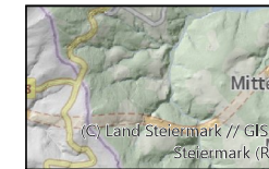
Grundkarte Anlage 2 basemap.at, Geländedaten Stand d. Daten 2019